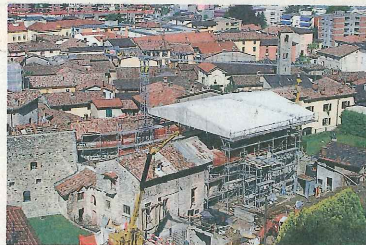
I lavori di ristrutturazione di Palazzo Busioni a Mendrisio.